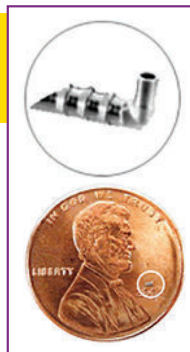
iStent is the Smallest Medical Device

Technology has always played an important role in the eye care we deliver. Today, every facet of vision is connected to a product or procedure that wasn't available a few short years ago. Cataract surgery is a good example of how innovations make a difference. Every aspect of it utilizes recently developed technology that will help us improve your vision. Today, this includes managing your glaucoma: now that we are able to add another step to your cataract surgery and treat glaucoma in a completely new way, without the inconvenience and expense of daily drops. The iStent Trabecular Micro-Bypass Stent is world's tiniest medical device, designed to reduce your eye pressure and you can have it done at the same time you have cataract surgery.